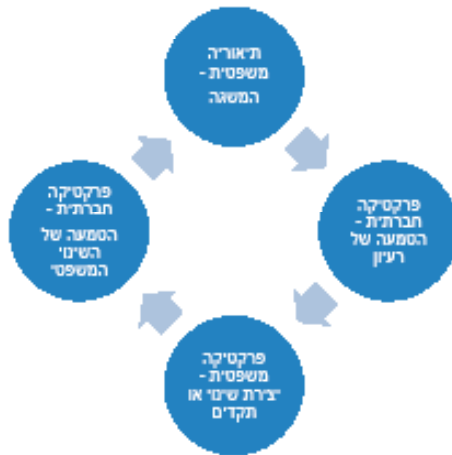
איור 2: המודל המעגלי של עריכת דין לשינוי חברתי

עריכת דין אקטיבית לשינוי חברתי היא חלק מהליך מעגלי נמשך: